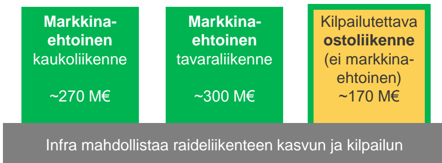
Julkiset ostot ja tuet