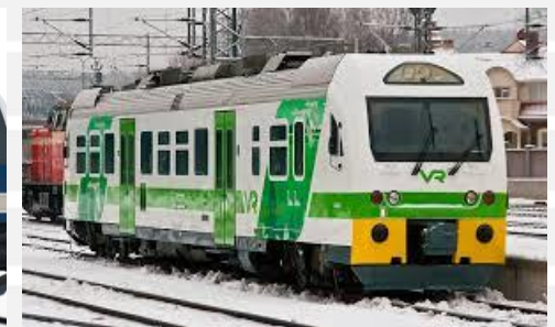
Ostoliikenteen kalustoyhtiöön soveltuvaa kalustoa.